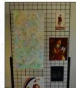
Certaines toiles seront acheminées dans différents services.